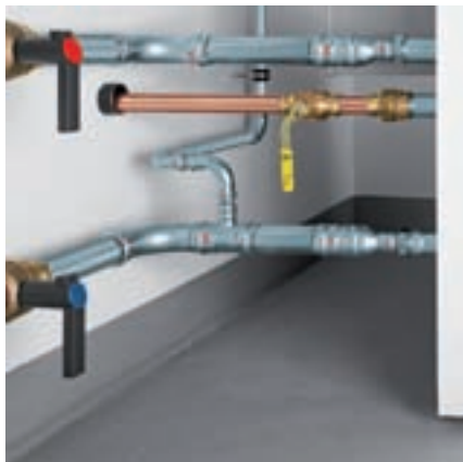
Aansluiting verwarmingsketel: toevoer- en retourleiding met Prestabo en Easytop-kogelkranen. Gasaansluiting met Profipress G.