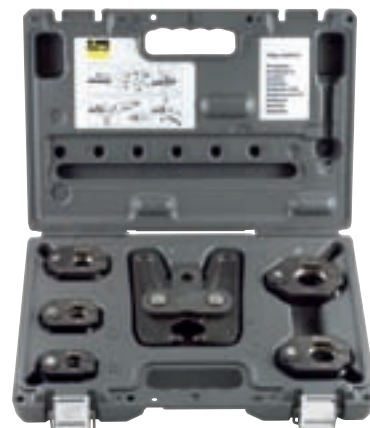
De koffer bevat 5 persringen in de afmetingen 15 t/m 35 mm en de zwenkbek Z1 met gepatenteerde scharnierfunctie. Viega biedt ook een koffer aan voor de zwenkbek Z2 met twee persringen in de afmetingen 42 en 54 mm (zonder afb.).