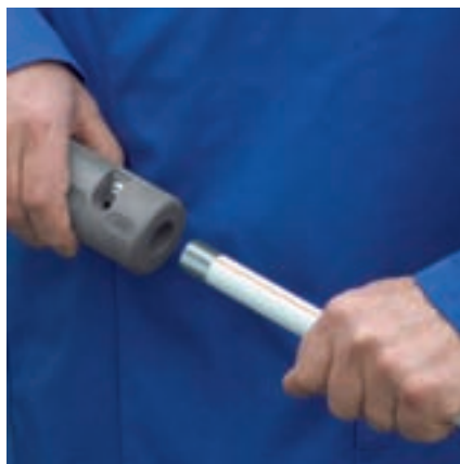
De Viega-mantelbuisstripper voor de witte ommanteling van de Prestabo-buizen.

Voor de verwerking van Prestabo heeft Viega gereedschappen ontwikkeld die een maximum aan comfort en zekerheid garanderen: met de mantelbuisstripper verwijderd u de witte PP-ommanteling van de buizen voor de opbouwinstallaties. Met de Viega-persgereedschappen brengt u vervolgens binnen seconden betrouwbare verbindingen tot stand.