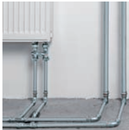
Prestabo betekent veelzijdigheid in de verwarmingsinstallatie.